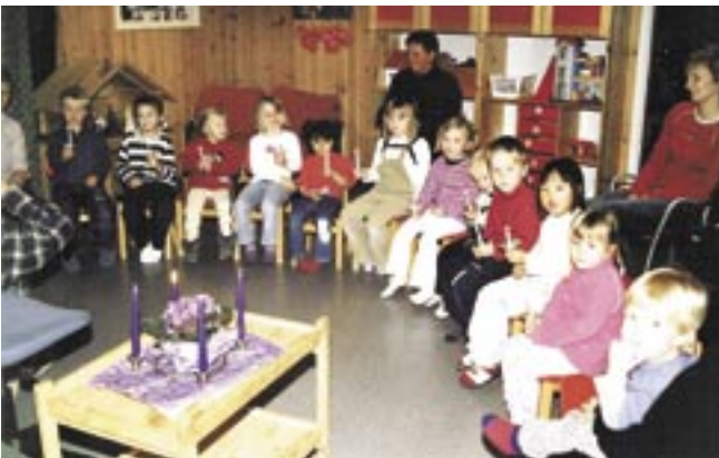
Så mange flotte barn. Og alle gleder seg over at det er advent og kanskje litt til jul?