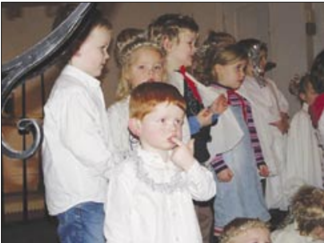
Her ser vi et glimt fra avslutningen før jul for Auglend skole og barnehagen i Døvekirken i Stavanger. Barnehagen har som vi ser her Luciaopptog.