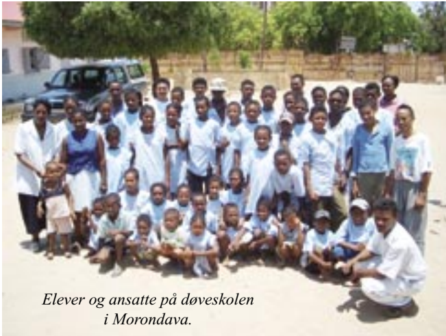
Elever og ansatte på døveskolen i Morondava.