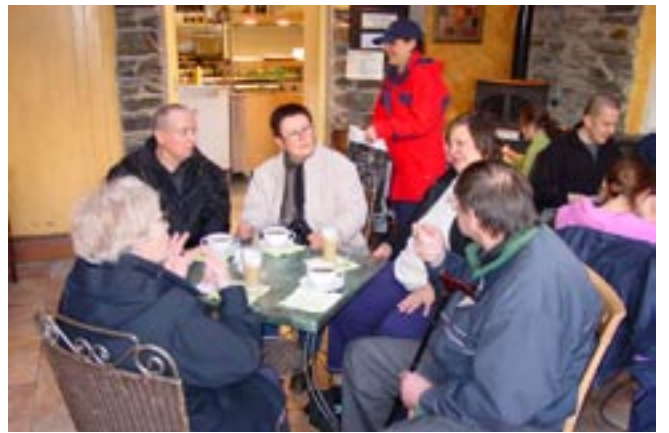
Hyggelig prat med engelske venner.