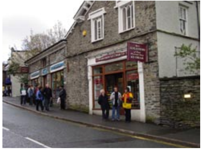
Den anglikanske menigheten stilte med minibusser og tok oss med på tur til Windermere i idylliske Lake distrikt. Her ble det også anledning til båttur. På hjemturen var det bestilt middag på en pub i Bolton.