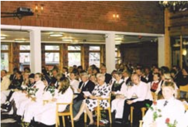
En feststemt menighet omgir konfirmantene