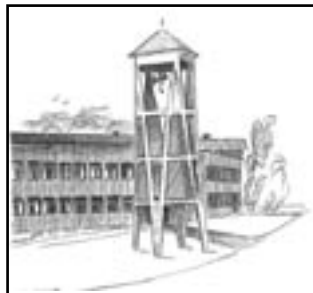
Oslo nye døvekirke fyller 30 år Illustrasjon: Lillian Ermesjø.

Kirkecafe: Ulike uker kl 14-18. Middag serveres kl 16.