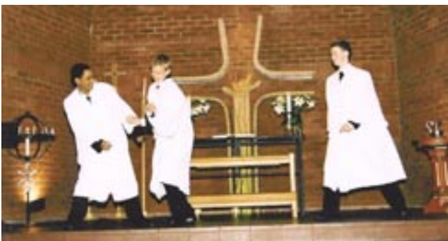
Drama over de 10 bud