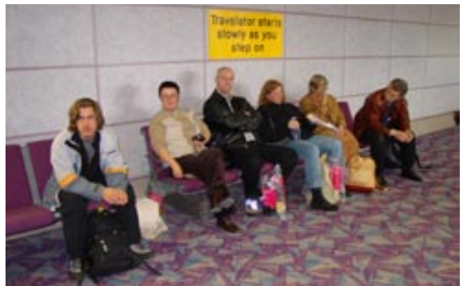
Fornøyde, men slitne deltagere på flyplassen i Manchester.