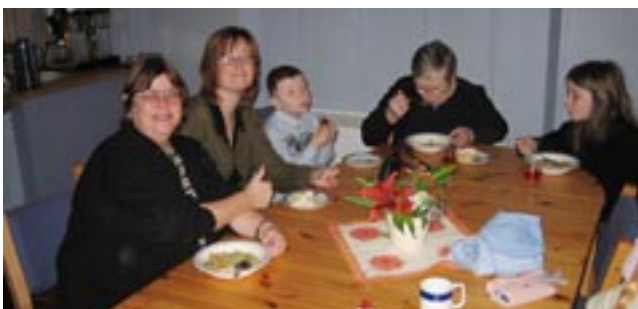
Tekst og foto: Arnstein Overøye.