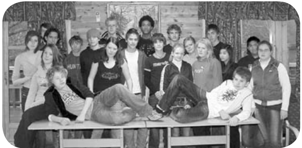
Her er hele gjengen som var med på MILK kurs i Kristiansand.

I de få månedene mellom mai og oktober har vi vokst enda noen centimeter. Vi har vært litt flere steder enn vi hadde vært sist. Og vi hadde opplevd litt mer.