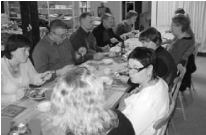
Nytt og gammelt menighetsråd i Bergen møttes sammen med ansatte til juletallerken i begynnelsen av desember.

4 år går usedvanlig fort. Det føles ikke som det er så lenge siden vil sist valgte nye menighetsråd. Kanskje fordi prosessen tar så lang tid? Allerede i februar startet menighetsrådet forberedelsene til årets valg. Rundskriv fra Kirkerådet ble omhyggelig lest og menighetsrådet var enig i den tidsplanen daglig leder hadde foreslått. – Så kom første endring; pga høstferien passet det særdeles dårlig å ha valg de to offisielle valgdagene. Hva gjorde vi da, jo vi søkte om utsettelse etter alle kunstens regler og fikk det. Så kom neste utfordring, eller egentlig ikke en utfordring, heller en gledelig melding. Kirkerådet hadde bestemt at stemmerettsalderen kunne senkes til fylte 15 år i løpet av valgåret. Eneste betingelsen var at menighetsrådet måtte fatte vedtak om det. Med den aktive ungdomsgruppen vi har i vår menighet, var det ikke vanskelig å fatte et slikt vedtak. Det var dessuten i tråd med det ungdommene som deltok på Døvekirkenes fellesmøter på Risøya og i Bergen, ønsket seg.