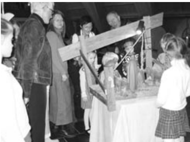
Samling rundt julekrybben i Volsdalen kirke

Her er noen bilder fra denne julefesten;