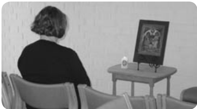
Ved treenighetsikonet kunne vi stanse opp og reflektere over: Hvem ber vi til? Hvem møter vi i kirken? Hvilke gudsbilder har vi?

Som en hjelp til dette snakkes det i hørende sammenheng om taus retreat. Men i døvekirken virker det merkelig å arrangere en "stille dag". Men er det likevel mulig å overføre noe fra denne måten å nærme seg Gud på til vår