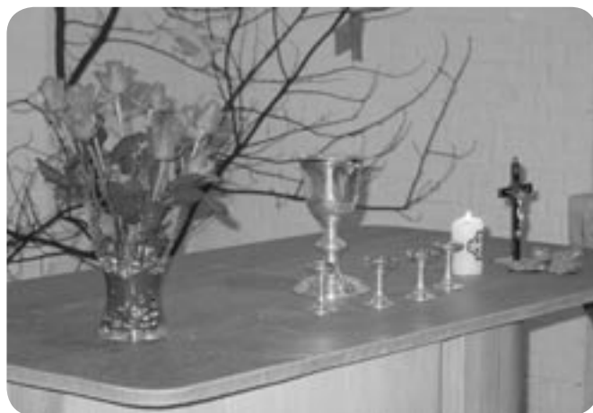
Samlingen ble avsluttet med nattverd.

I kirkerommet og i sakristiet var det stasjoner hvor en kunne sitte i ro og be, tenne lys eller røkelse osv. Retreaten startet ved at vi etter en innledning i våpenhuset sammen gikk fra stasjon til stasjon hvor jeg ga noen korte impulser. Etterpå kunne vi gå fra stasjon til stasjon og bruke den