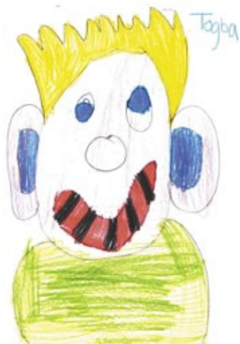
Tegnet av Togba Ilgun ved SFO i Bergen.