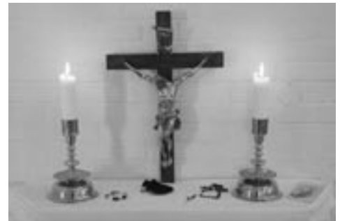
Bildet er fra retretten som var i Bergen 1.april i år. På alteret fra den gamle døvekirken lå en kristuskranse og en rosenkrans. Her kunne vi stanse opp og reflektere over vårt eget bønneliv

Kristentroen har artet seg på mange forskjellige måter opp gjennom historien. Idealene for rett kristen livsførsel har variert. Mens munkene og nonnene tidligere ble sett på som et ideal, blir de i vår del av verden ofte mer sett på som kuriositeter. Fra de tidlige kristne tider kjenner vi også de såkalte ørkenfedrene, mennesker som søkte ensomhet ute i ørkenen, spesielt i Egypt. Men ryktet om deres livsvisdom gjorde at det kunne bli så som så med ensomheten. I dag ser vi ikke på ørkenfedrene som idealer for hvordan vi skal leve det kristne livet. Men mange av fortellingene etter dem kan lære oss mye. Min favoritt er denne: