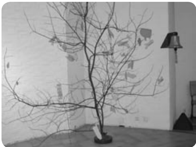
Bønnetreet var plassert i hjørnet bak alteret, vi kunne brette traner eller fredsduer ute i menighetssalen, og henge dem på treet som en synlig bønn.

Retrett (eller retreat som også brukes) har vært arrangert for hørende i Norge i 50 år. Retrett handler om å fjerne seg fra det som hindrer oss i kontakt med Gud. Jesus gikk selv avsides for å be. Han tok sine disipler med til steder der han kunne være alene med dem. Retrett er å være alene sammen med Herren, men samtidig sammen med hverandre. Det kan skje på forskjellige måter. Det viktige er at vi har fokus på samtalen med Gud, ikke på samtalen med hverandre.