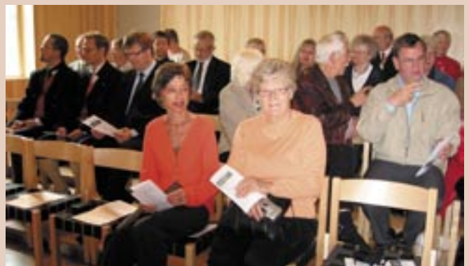
Forventningsfull menighet i Tromsø.

Menigheten sier TUSENTAKK for alle disse flotte gavene!