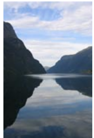
Hyenfjorden / flott natur.

Harald Gåsland