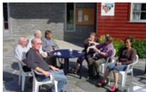
Samtale på leirplassen