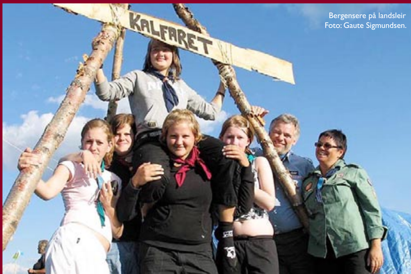
Bergensere på landsleir