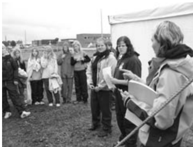
Tegnspråkverksted under aktivitetsdagen