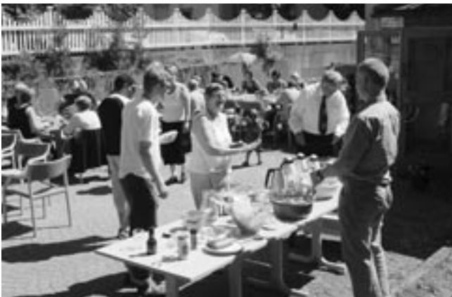
Den årlige hagefesten i Bergen ble arrangert etter gudstjenesten søndag 11. juni. En hyggelig dag i nydelig vær, og som vanlig stod grilling på programmet