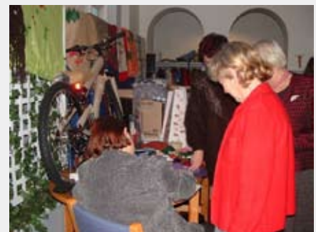
Navneskrivning i basarbøkene.