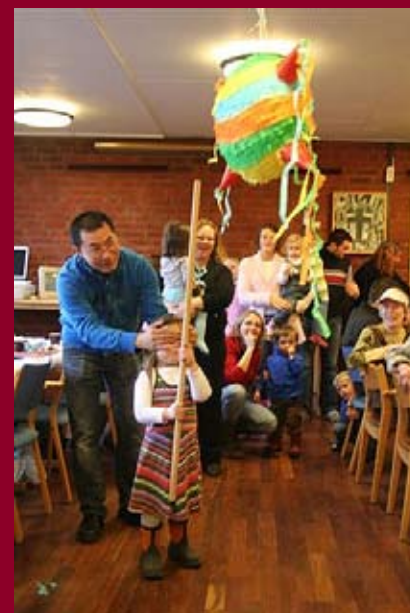
Over: Fra "Barnas dag" i Oslo. Til venstre: Utsnitt av altertavlen i Tromsø Døvekirke