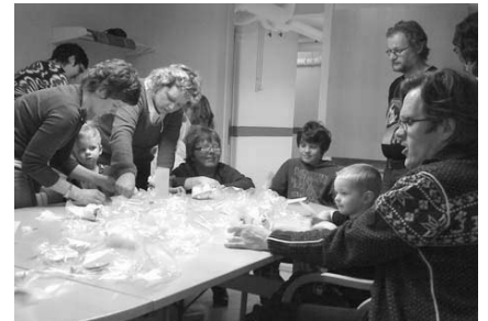
Her er det påskeverksted med stor aktivitet!