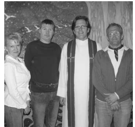
Sentrale aktører på det som nå skjer i Vestfold."

Når det er slike fredager, er programmet slik: KI 14-16: ÅPENT HUS med vafler og hyggelig prat KI 16.30: MIDDAG KI 17-18: BARNEKLUBB. KI 18-19: GUDSJENESTE for barn, ungdom, familier, voksne og eldre. KI 19-22: UNGDOMSKLUBB