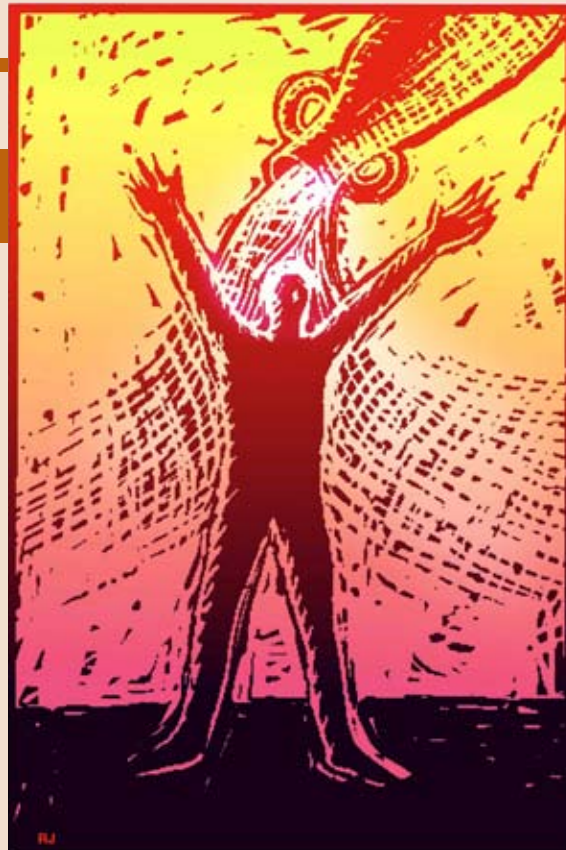
Tegnet av Rolf Jansson