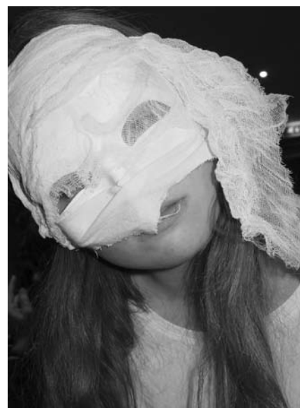
Et av spøkelsene fra Klosterbakken."