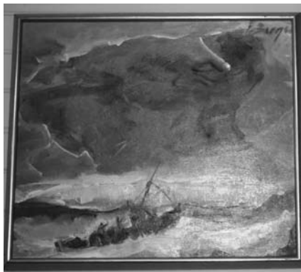
Nærheten til havet og fiske er tydelig

Det var mange som kom til jubileumsfeiringen, ca 120 til sammen.