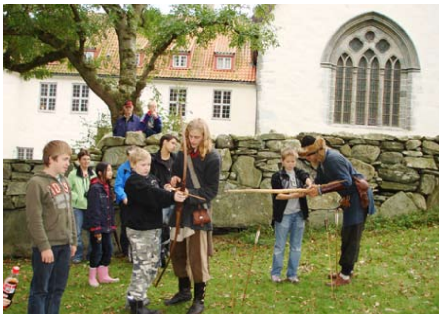
Vikingdag på Utstein kloster

Etterpå var det omvisning i klosteret. Så var turen over, og vi måtte dra hjem. Barna var allerede klare for en ny tur, kunne de fortelle på veien hjem. Det får vi tolke som et signal om at dette var en fin og minnerik opplevelse for barna!