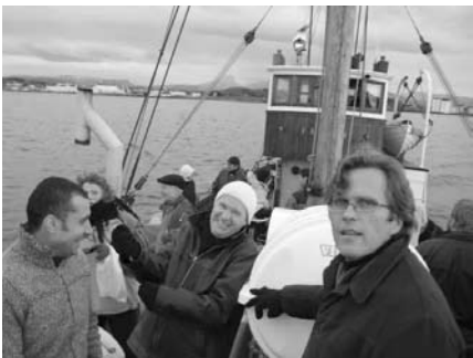
Stor stemning om bord på sjarken.

Representanter fra Døveforbundet, Fylkeslaget Nordland, tolkesentralen og Signo kom og fortalte om hva de mente om Døvekirken i døvemiljøet og Døvekirken i framtida. Nordland savner mer besøk og etterlyser mer samarbeid lokalt. NDF fremhevet tegnspråkarbeidet som spesielt viktig. Dette var verdifull respons for oss alle som jobber i kirken, og absolutt noe å ta med videre!