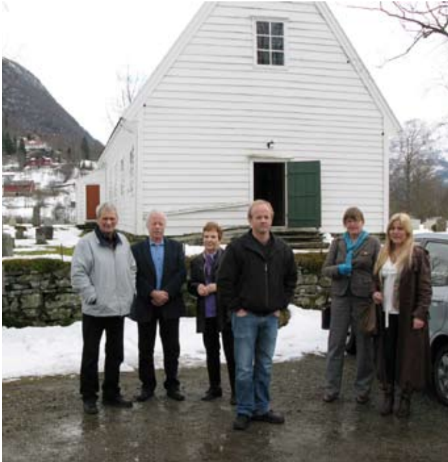
Noen av de som var med på gudstjenesten i Ålhus.