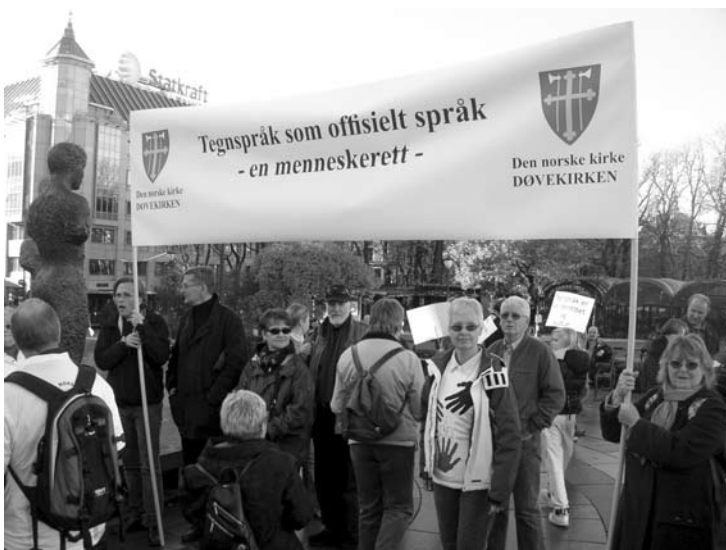
Døvekirken var synlig tilstede under demonstrasjonene for tegnspråk som offentlig språk."

Under parolen "Tegnspråk som offisielt språk - en menneskerett" markerte Døvekirken - på vegne av Den norske Kirke - sin støtte til Norges Døveforbunds krav om heving av tegnspråkets status i Norge.