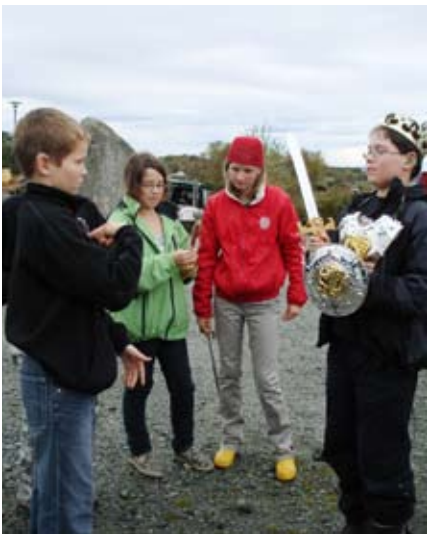
Saul og David (rollespill fra David og Goliat)

Skattejakten er et 3-årig prosjekt for døve barn i alderen 10-13 år i Døves menighet Stavanger/Det Sør-Vestenfjelske distrikt. Vi er nå inne i det siste året av prosjektet.