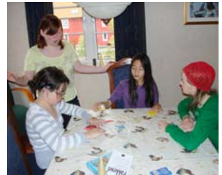
Jentene spiller spill

Søndagen hadde vi en ny Skattejaktssamling. Denne gangen var det fortellingen om Elia på Karmelfjellet som stod i fokus. Barna fikk skattekart over området rundt Sjøberg, og gruppevis lette de etter bokstavene som var gjemt rundt omkring, og som skulle settes sammen til et bibelsk navn. Deretter åpnet vi skattekista, og hadde ulike aktiviteter ute og inne knyttet til fortellingen om Elia.