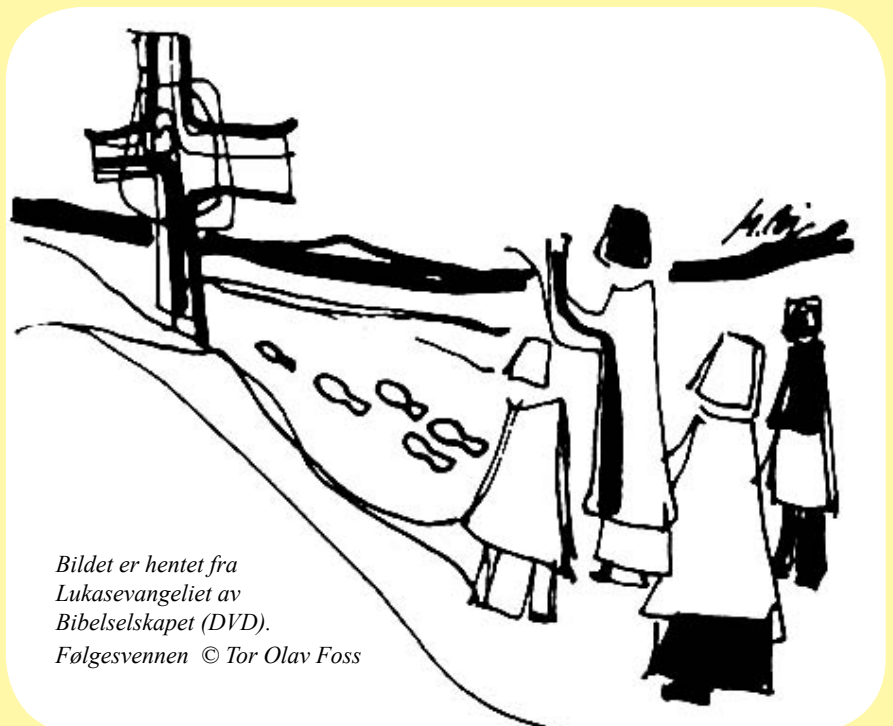
Bildet er hentet fra Lukasevangeliet av Bibelselskapet (DVD). Følgesvennen © Tor Olav Foss