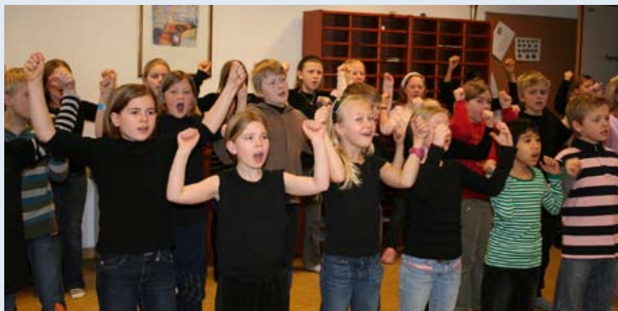
På Auglend skole ble vi møtt av et skolekor som hadde lært å synge med tegn. De var med under åpningen av kulturby året 2008 i Stavanger. Tegnkoret gjorde et sterkt innrykk på alle oss som fikk oppleve dem.

Vi ansatte har planlagt og jobbet for at visitasen skulle bli god. Menighetsrådet i Stavanger og Menighetsutvalget i Kristiansand har gjort en stor innsats. I tillegg møtte mange døve opp som deltakere, og for å gjøre en innsats, både i Kristiansand og Stavanger. Sammen bidro alle til å løfte fram mangfoldet i døvemiljøet.