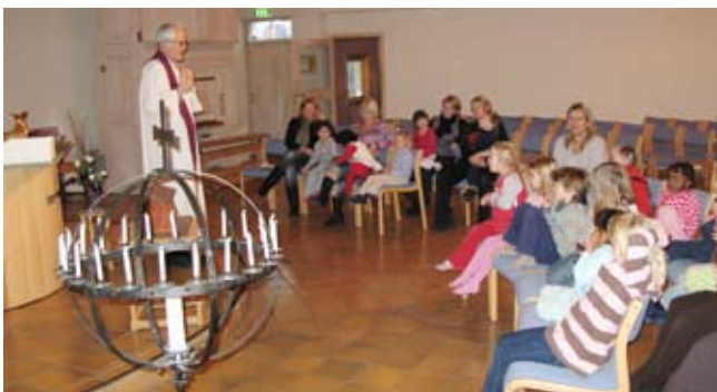
Barnehagegudstjeneste i Bergen Døvekirke