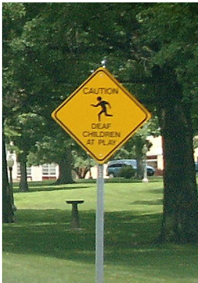
Advarsel: Døve barn leker/spiller

Stoff sendes til redaktøren Juliane Eftevåg, Musseronstien 13 H, 4635 Kr.sand, e-mail: juliane.eftevaag@losmail.no SMS: 97586714