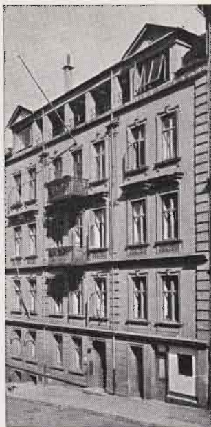
Døves Hus i Bergen.