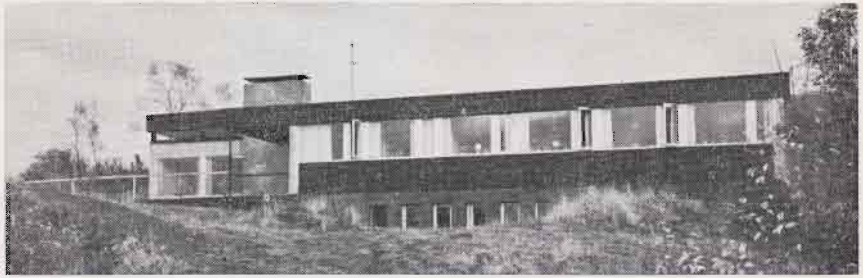
Døves Aldershjem, Gerhard Gransvei 35, Landås.