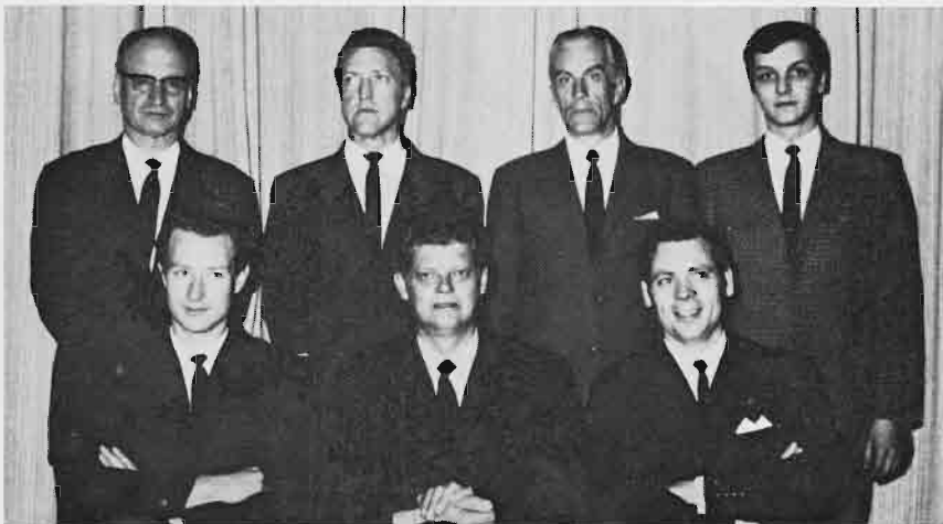
Foreningens styre i jubileumsåret.

Døves Dameklubb, stiftet 13. okt. 1902. Døves Idrettsklubb, stiftet 29. okt. 1905. Døves Sjakklubb, stiftet 25. januar 1946 Døves Ungdomsklubb, stiftet 25. oktober 1962 Døves Bridgeklubb, stiftet 3. febr. 1969.