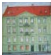
1924-1974 Vestre Torvgt. 20 a