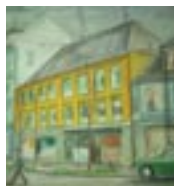
1880-1885 Nygaten 5