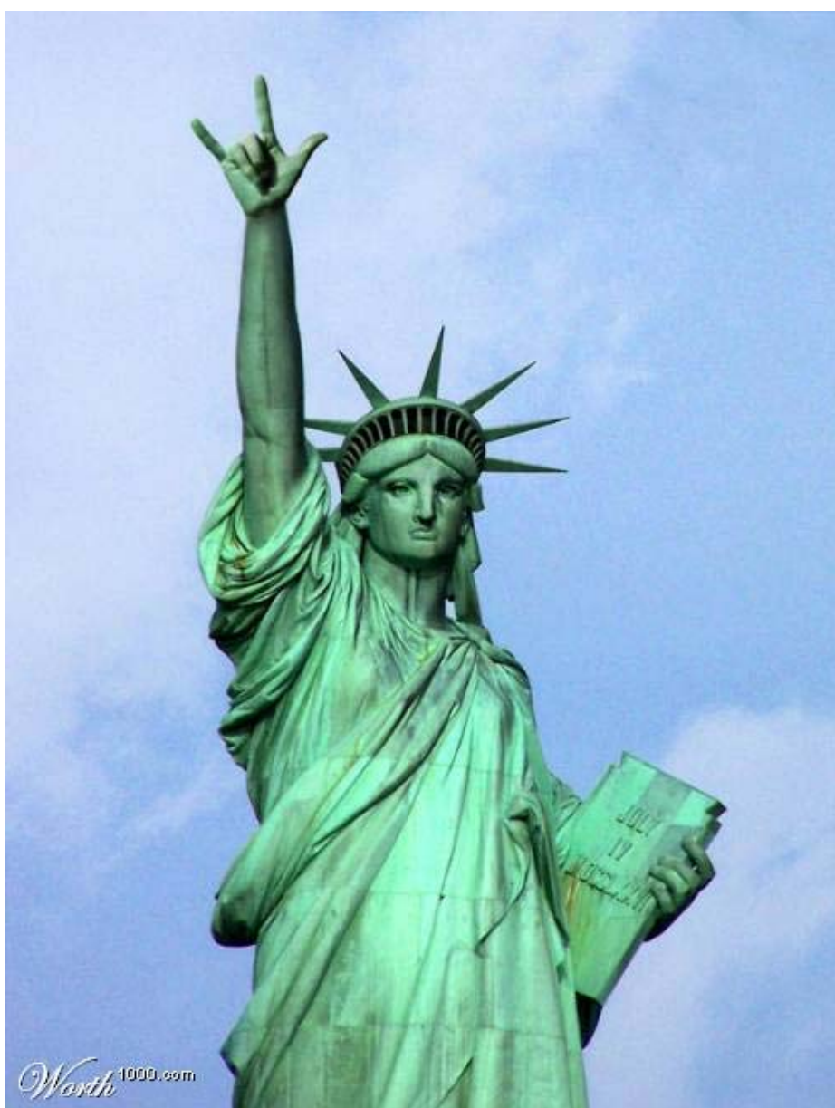
Bildet av Deaf-joke