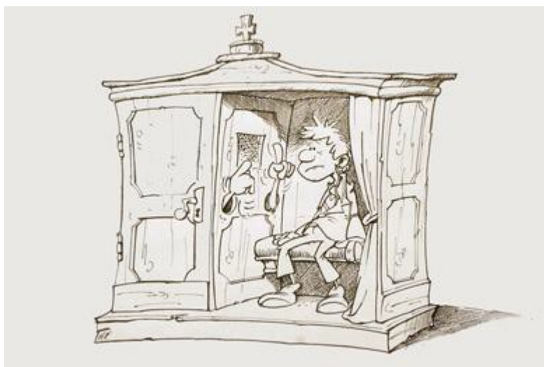
Bildet fra Deaf-joke

Så kan du sende din epost-adresse til meg på mobilen: 91 32 97 89 eller E-post: roy.e@online.no